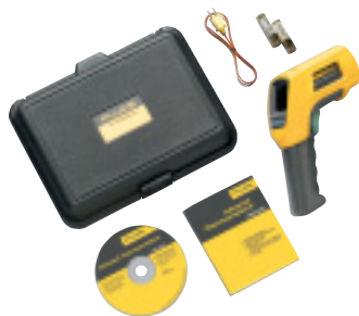
Le Fluke 566 et ses accessoires