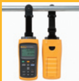
Sangle avec aimant TPAK