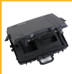
Mallette pour appareil et sonde