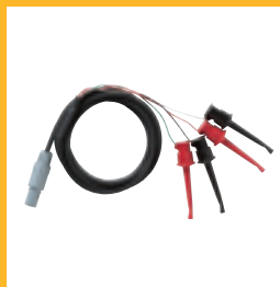
Adaptateur RTD universel