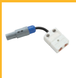
Adaptateur thermocouple universel