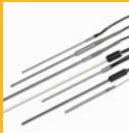
Capteurs de température étalonnés

Un large éventail d'accessoires peut vous aider à optimiser votre productivité. Les articles suivants seront toutefois incontournables pour la plupart des utilisateurs.