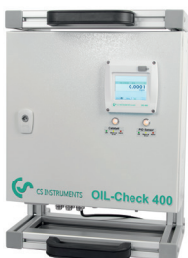
Poignée et support