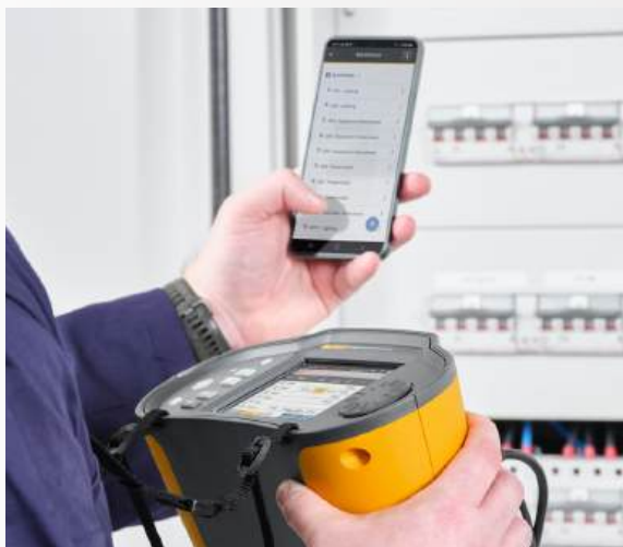
Verminder de handmatige gegevensinvoer en het bijhouden van de administratie