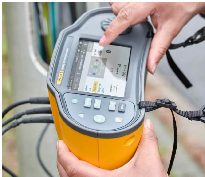
Kleurentouchscreen en tastbare draaiknop voor snelle navigatie

Met de 1670-serie kunt u uw vereiste tests sneller uitvoeren en de tijd die u besteedt aan documentatie verminderen, terwijl u volledig kan vertrouwen op de gegevens die u verzamelt.