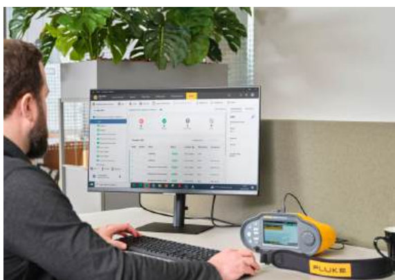
TruTest-software vereenvoudigt het beheer en de rapportage van elektrische systeemgegevens

Met de TruTest-software van Fluke kunt u certificaten maken die voldoen aan een groeiende lijst met regionale rapporten, waaronder BS7671, DIN VDE 0100-600, ÖVE/ÖNORM E 8101, NIN/NIV, NEN3140 en andere Europese installatietestnormen. Al deze rapporten zijn met één druk op de knop beschikbaar en een voorgeconfigureerde internationale sjabloon zorgt ervoor dat de TruTest-software elke locatie dekt.