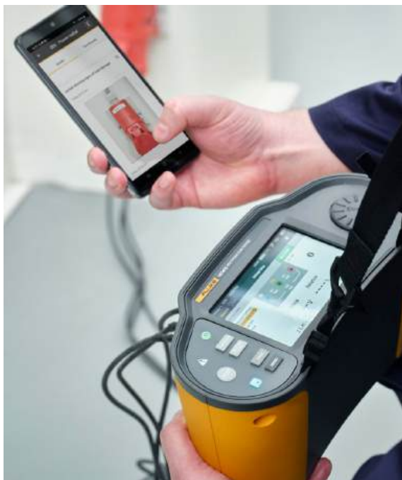
Wijs foto's rechtstreeks toe aan specifieke meetpunten voor meer gedetailleerde documentatie