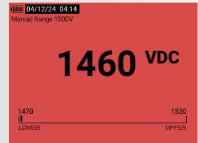
Limietmeter - buiten bereik