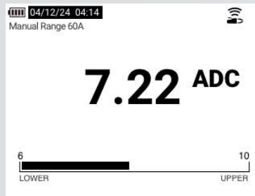
Limietmeter - binnen bereik

De 283 FC multimeter met veiligheidsspecificatie CAT III 1500 V/CAT IV 1000 V en de a283 FC draadloze stroomtang voldoen aan de veiligheidseisen voor testapparatuur (IEC 61010-2-032) die overeenkomen met het overspanningscategorieniveau van de elektrische installatie van het PV-array (IEC 61730-1). Combineer deze met TL175-HV premium siliconen meetsnoeren met veiligheidsspecificatie CAT III 1500 V/CAT IV 1000 V, CAT III 1500 V MC4-connectoren en u beschikt over een uitgebreide eerstelijns oplossing voor storingzoekers waarmee u veilig en nauwkeurig spanning kunt meten voor het opsporen en verhelpen van storingen van omvormers, combinerkasten, reeksen modules of afzonderlijke modules.