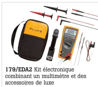
179/EDA2 Kit électronique combinant un multimètre et des accessoires de luxe