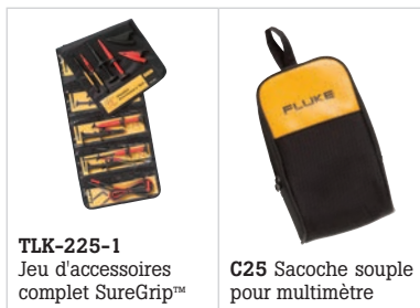
TLK-225-1 Jeu d'accessoires complet SureGrip™