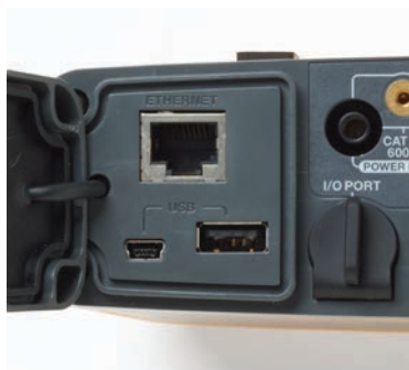
Ports USB et Ethernet.