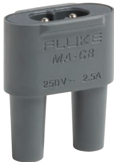
Adaptateur MA-C8 pour alimentation avec le cordon secteur.