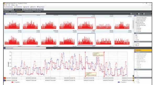
L'affichage du calendrier indique les heures, les jours et les semaines sous la forme de vignettes afin d'offrir rapidement des aperçus.