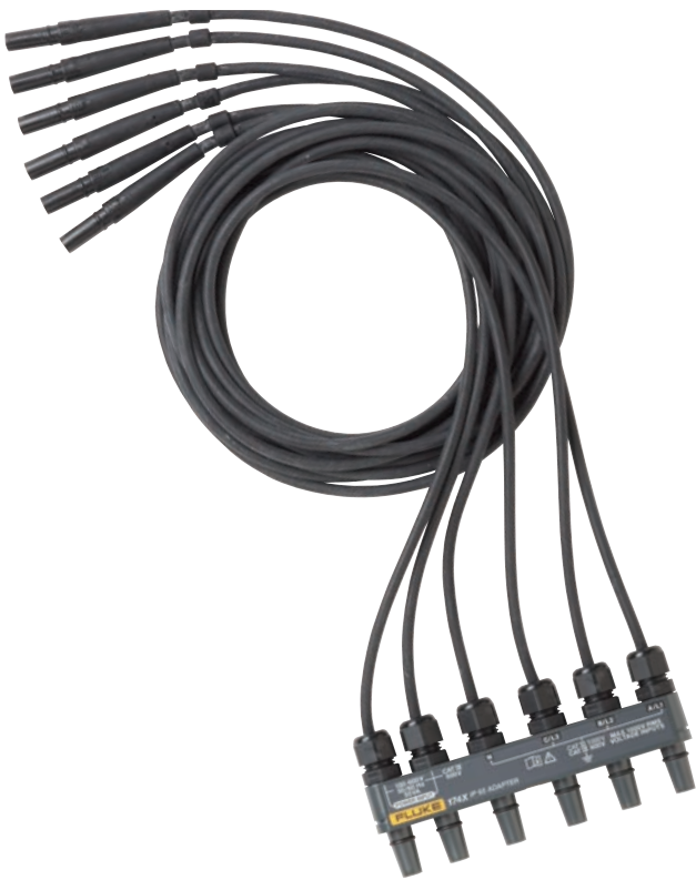
Connecteur de tension classé IP65 (en option).