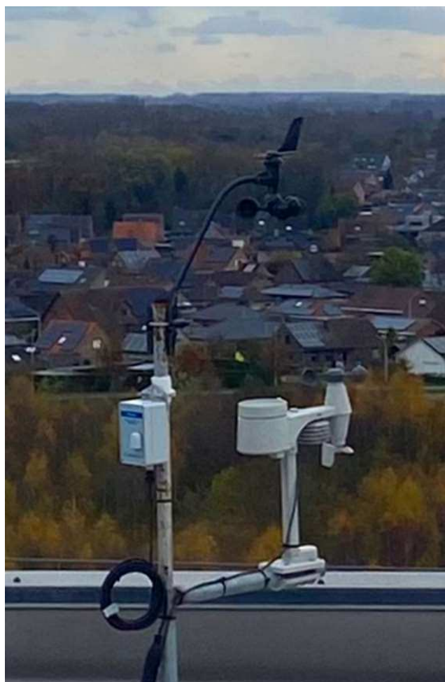
Foto : Voorstelling van de meetoplossing waar wind-snelheden /-richtingen, regenhoeveelheid en temperatuur en fijnstofgehalte gemeten en gemonitord wordt.

Tempco heeft een basisoplossing uitgewerkt om regen / windsnelheden en richtingen / temperaturen / vochtigheden ea. parameters zoals fijn stof, te meten en op te volgen.